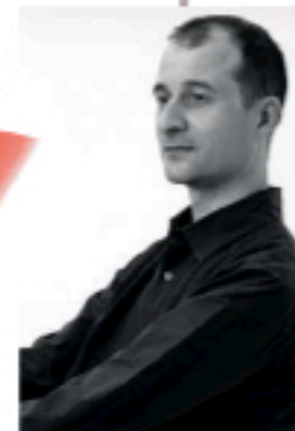
Le designer a imaginé une radio 100 % cuir.

Qu'est-ce qui vous passionne dans le cuir ?