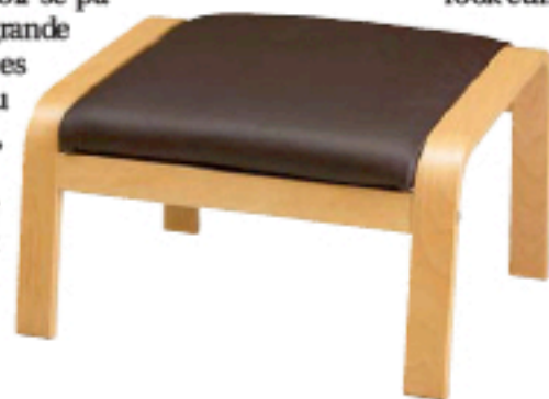
CLASSE ÉCO Repose-pieds en cuir et bouleau, Poäng chez Ikea, 89 €.

Chez Edra, autre grand éditeur de mobilier italien, le propos est similaire. Comme l'explique son