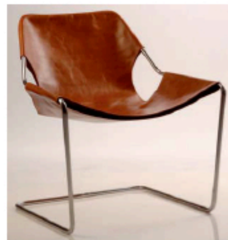
BRÉSILIEN Le mythique fauteuil Paulistano réédité par le français Objekto, 1 315 €.

Chez Carium, agence de conseil en intérieurs cuir sur mesure pour automobiles, ●●●