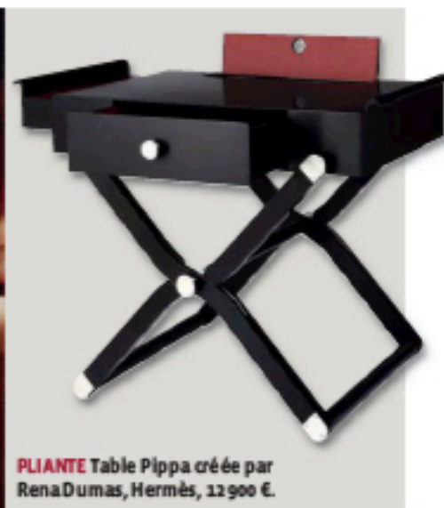
PLIANTE Table Pippa créée par Rena Dumas, Hermès, 12 900 €.

On explique que ce matériau « évolue de pair avec l'univers du design mobilier, des nouvelles technologies et de la mode. Source d'inspiration directe, ces disciplines permettent à l'agence de mettre au point, chaque saison, une collection de couleurs tendancées et de proposer, par exemple, des cuirs thermoréactifs, ou même écologiques ».