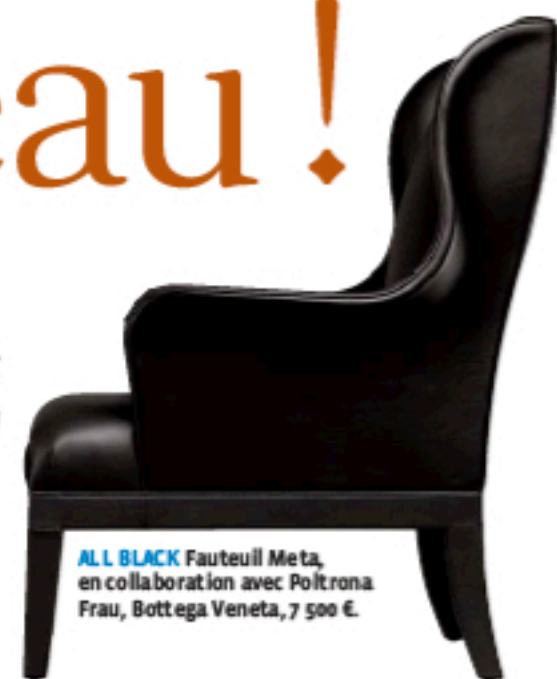
ALL BLACK Fauteuil Meta, en collaboration avec Poltrona Frau, Bottega Veneta, 7 500 €.

Technologique, écologique et créatif : le cuir est tout à la fois ! Et désormais, il fait sa mue pour donner naissance à de nouveaux produits et à des sensations inédites qui inspirent les designers.